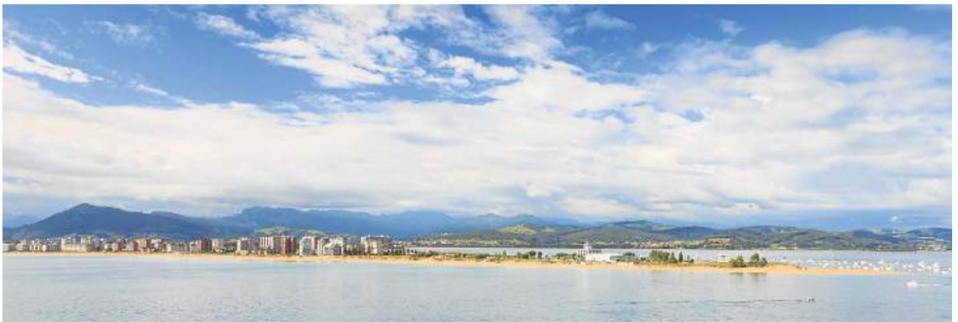
Vista del puntal, con Laredo al fondo.

nado de Transportes del Besaya. Se ha puesto en marcha la Red Municipal de Cargadores Eléctricos, el servicio de coches compartidos, se ha aprobado el Plan de Movilidad y en 2022 habrá un servicio de bicicletas eléctricas.