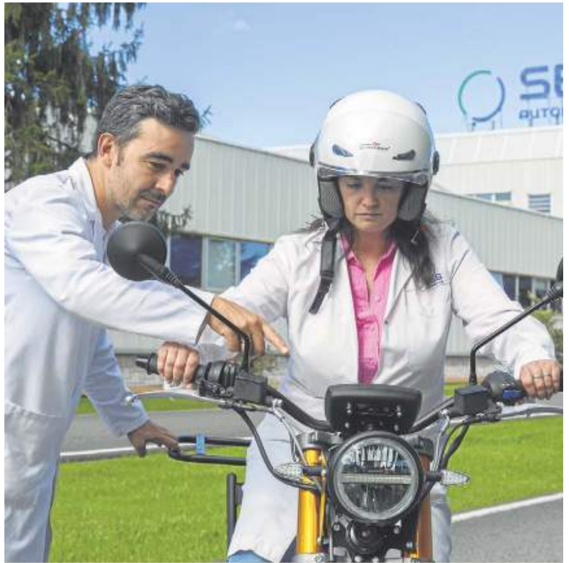
SEG Automotive es una planta moderna, liderada por la experiencia de sus trabajadores. DM

Estamos ante un actor relevante de la industria de Cantabria que se ha reinventado para destacar en el nuevo escenario de la movilidad sostenible.