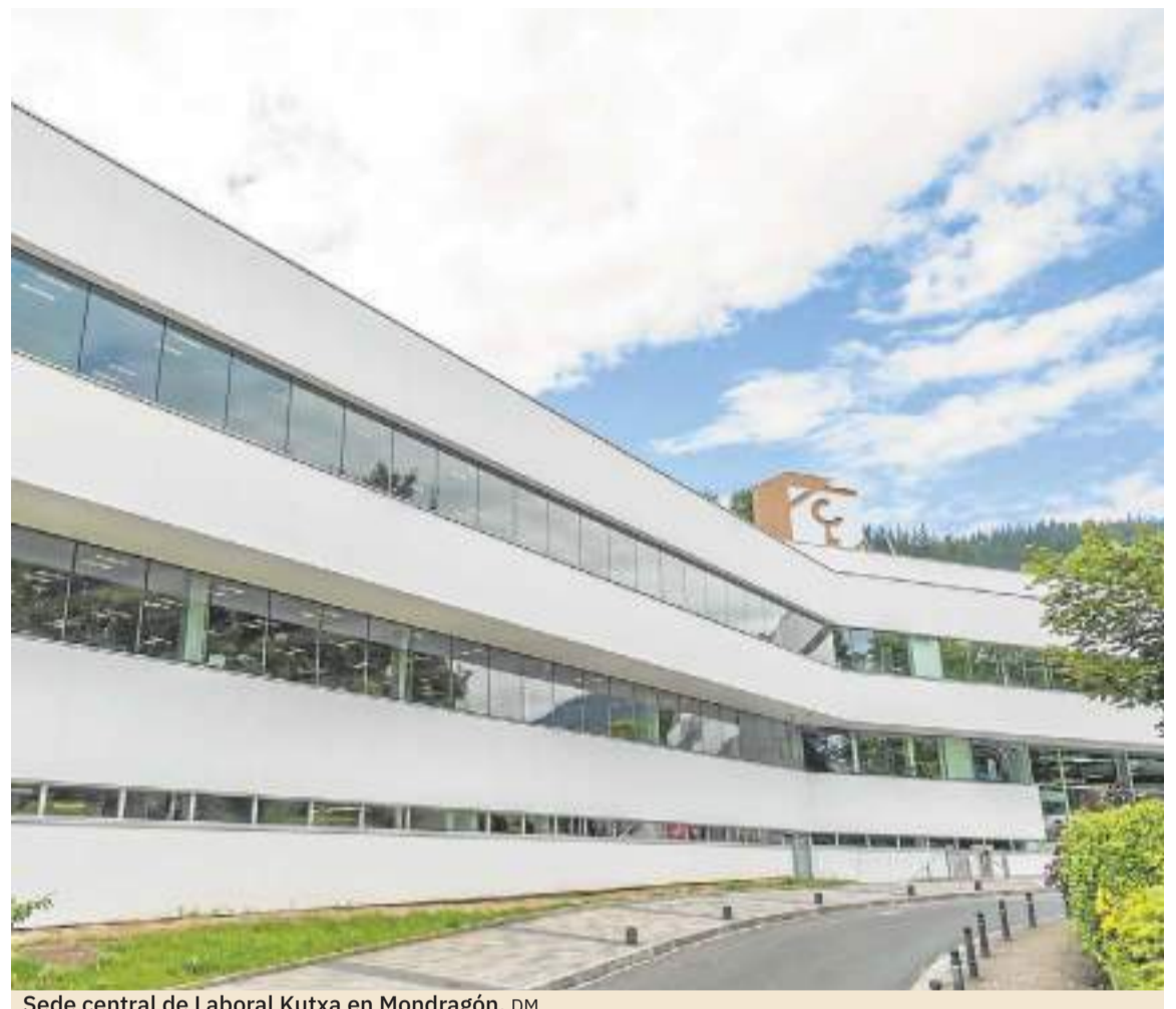
Sede central de Laboral Kutxa en Mondragón. DM

Actualmente en Cantabria contamos con cuatro oficinas, localizadas en Castro Urdiales, Torrelavega, Maliaño y Santander, además de los servicios especializados de