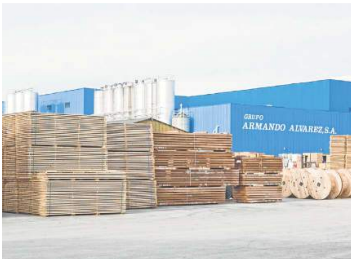
Instalaciones de Álvarez Maderas y Envases en Torrelavega. DM

Apostando por el crecimiento, han instalado una nueva línea de producción de bidones metálicos que les permite aumentar la productividad, competitividad y flexibilidad en los formatos que ofrecen de este producto. Además, están invirtiendo en la renovación de prensas e instalaciones para cum-