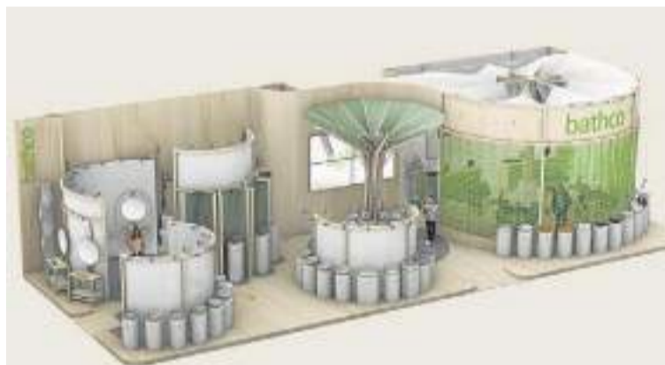
Infografía del stand que presentará en Milán.

Bathco presentará sus últimas creaciones en la prestigiosa Feria del Mueble de Milán que se celebra el próximo mes de abril