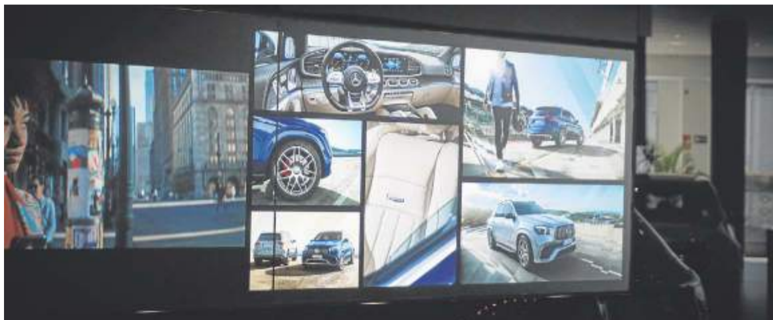
Tecnología, diseño, funcionalidad y conectividad representan la nueva generación de vehículos eléctricos de la marca. DM

El nuevo EQE es la berlina deportiva 100% eléctrica de Mercedes-EQ. Cuenta con una autonomía eléctrica