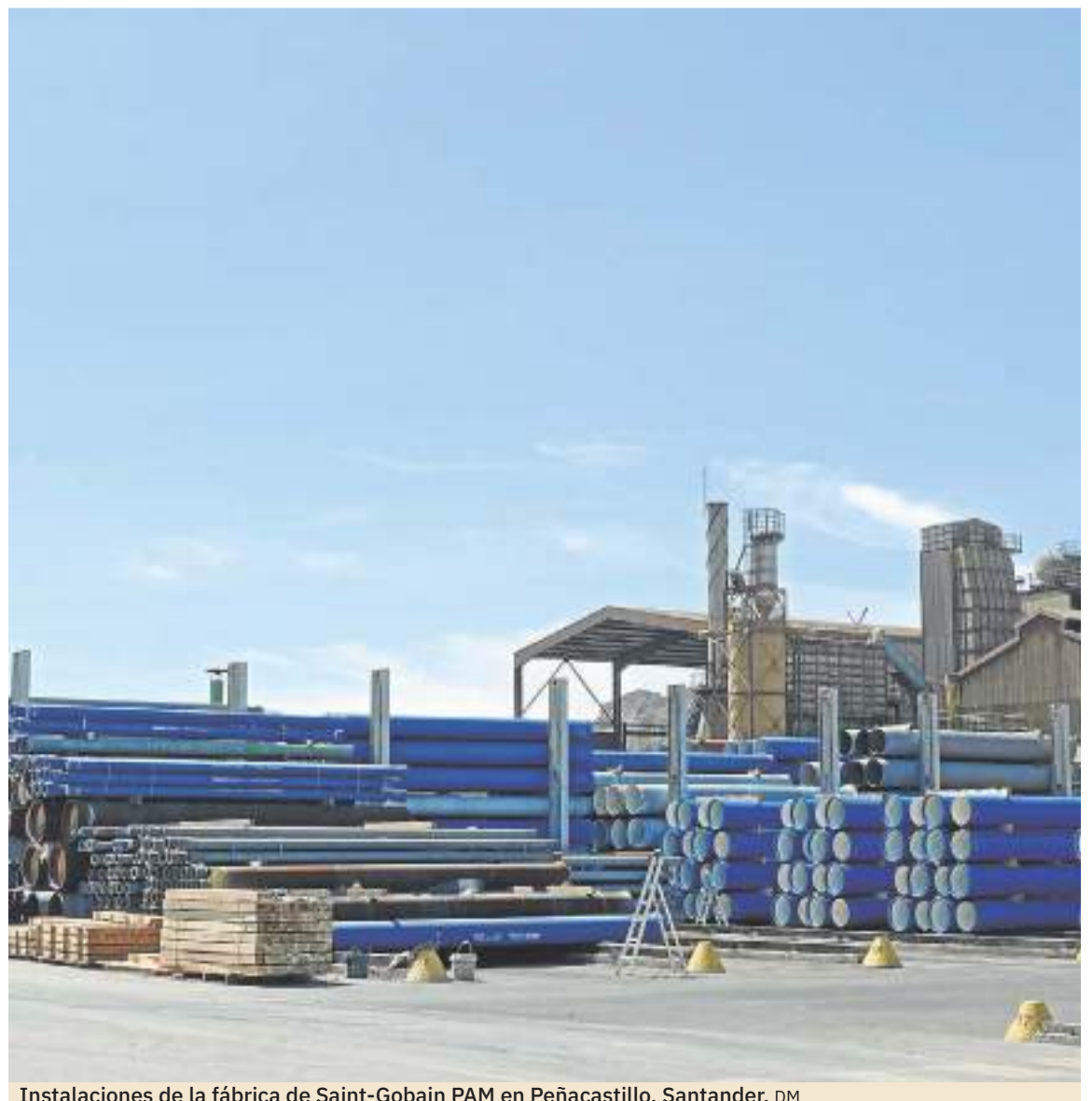
Instalaciones de la fábrica de Saint-Gobain PAM en Peñacastillo, Santander.

SG PAM se ha consolidado como un referente en la industria por su gran compromiso con la sostenibilidad y la economía circular, contribuyendo al cuidado del medioambiente y a la construcción de un futuro mejor. Por esta razón, trabaja día a día en desarrollar prácticas y soluciones sostenibles en toda su cadena de valor, desde la selección de materias primas, la gestión de residuos, la recuperación de productos al final de su vida útil y el consumo responsable de energías y recursos como el agua, en todos sus procesos.