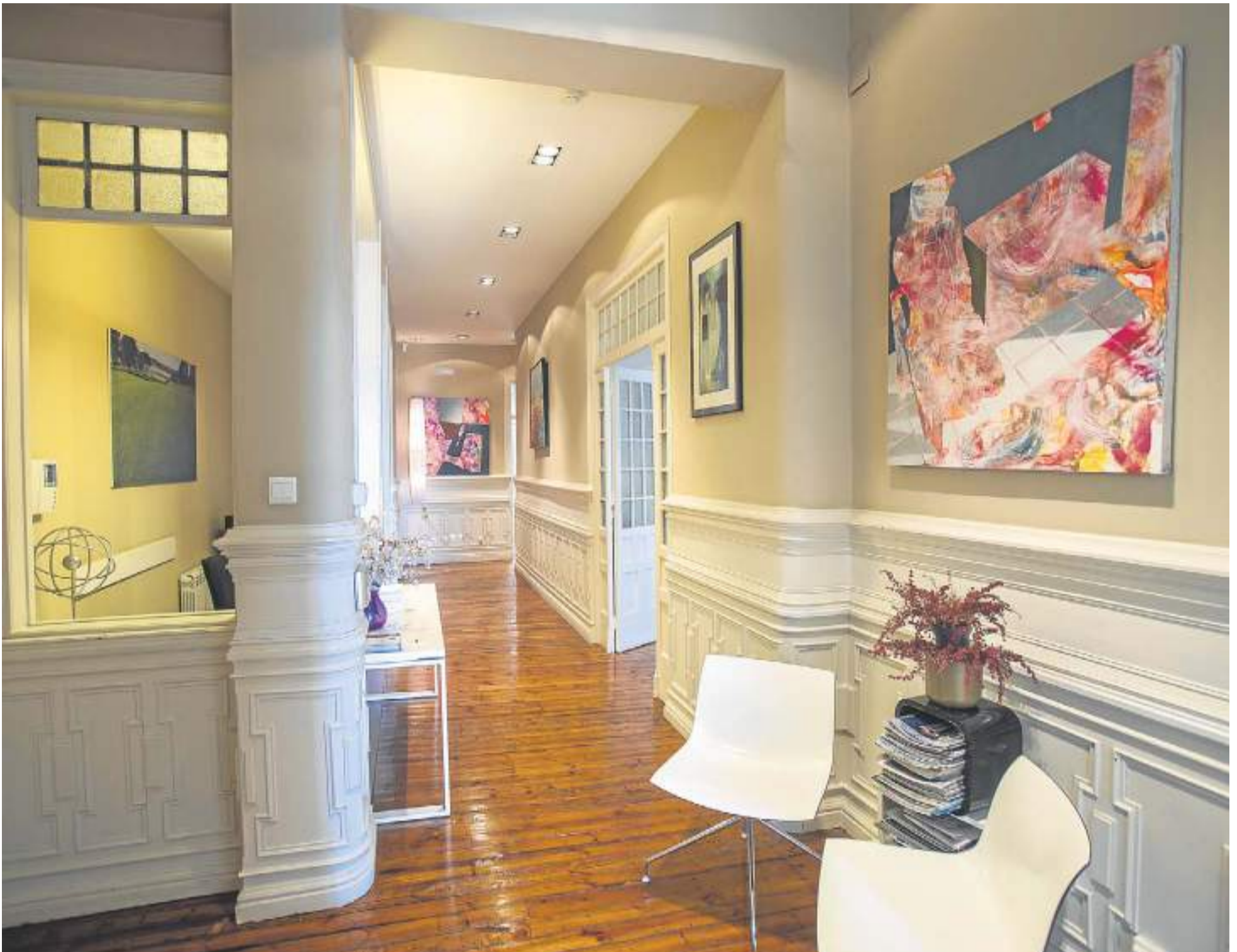
Interior del despacho ubicado en el número 31 del Paseo de Pereda. JAVIER COTERA