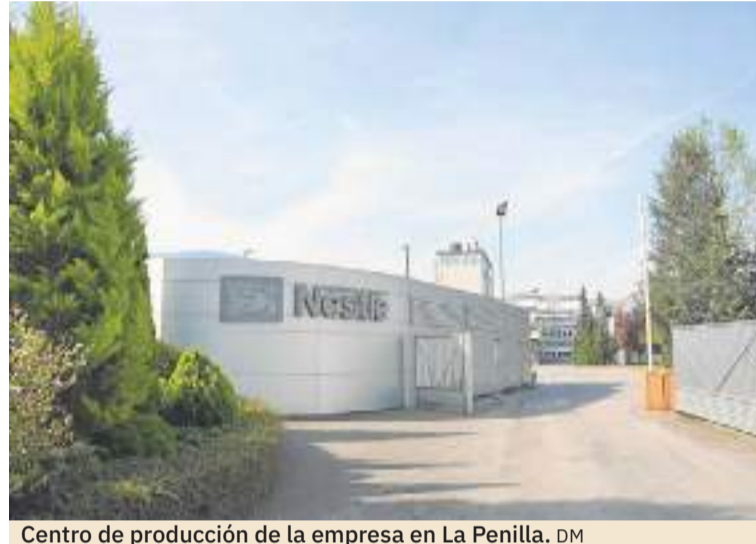
Centro de producción de la empresa en La Penilla.

El 100% de las papillas infantiles Nestlé que se elaboran en La Penilla contienen cereales de origen local y sostenible y hasta el 30% procede de la agricultura regenerativa