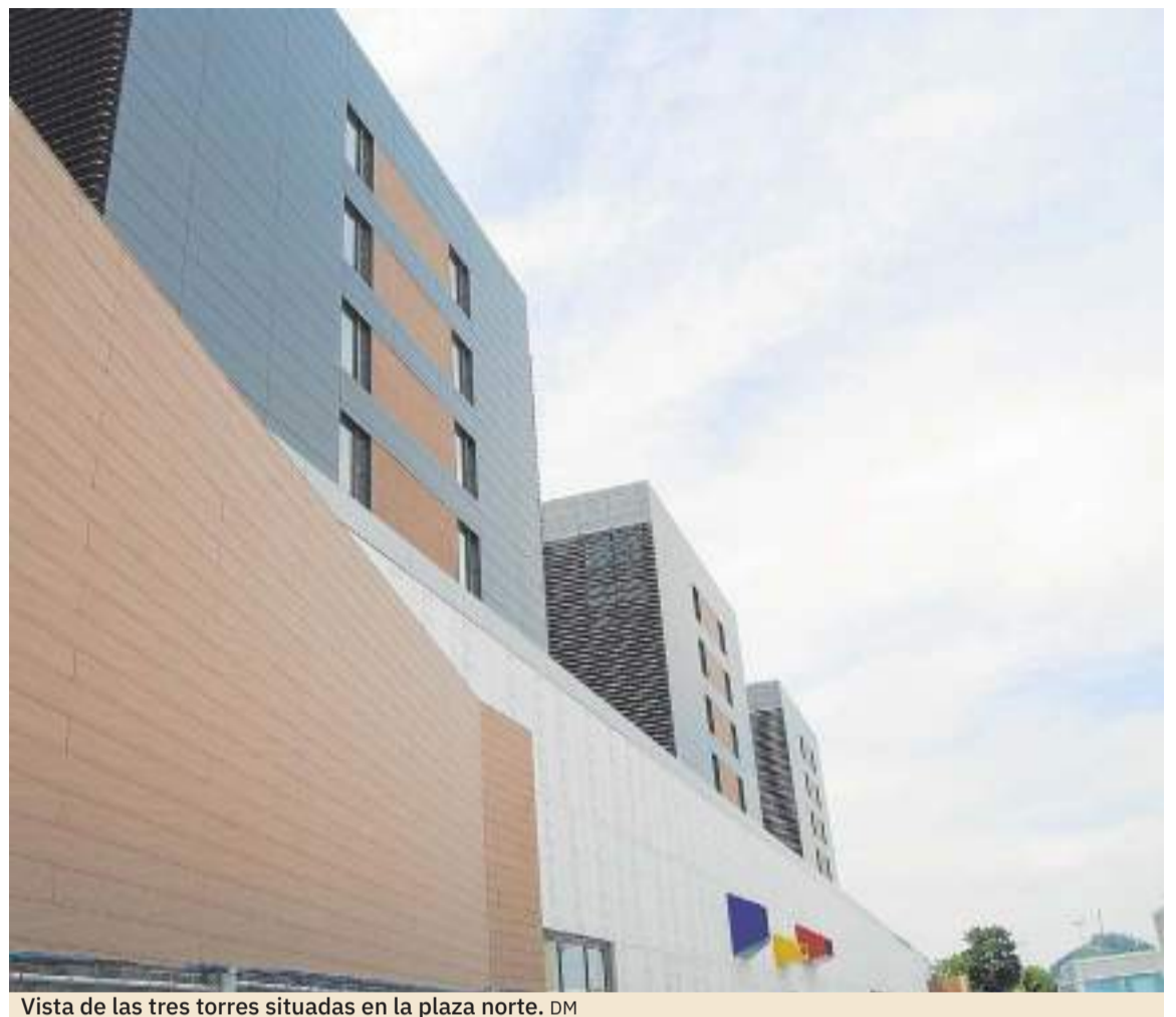
Vista de las tres torres situadas en la plaza norte.

El tándem Serveo-SIEC, que dio forma a Smart Hospital Cantabria, se erige como la UTE de referencia en nuestro país en la gestión de servicios no clínicos