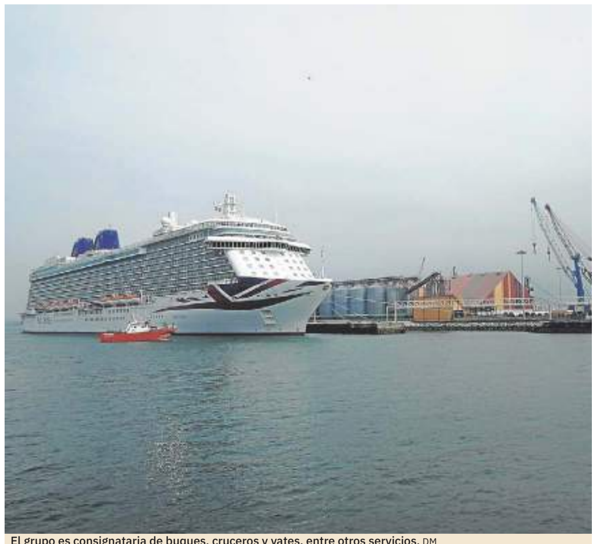
El grupo es consignataria de buques, cruceros y yates, entre otros servicios. DM

Prestamos servicios de apoyo global a los sectores naviero y logís-