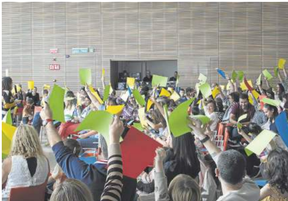
El Centro Botín es un espacio concebido para continuar y potenciar la labor en el ámbito de las artes plásticas y en el educativo. DM

El patronato desarrolla programas en distintos ámbitos y apoya a instituciones sociales de Cantabria para llegar a quienes más lo necesitan