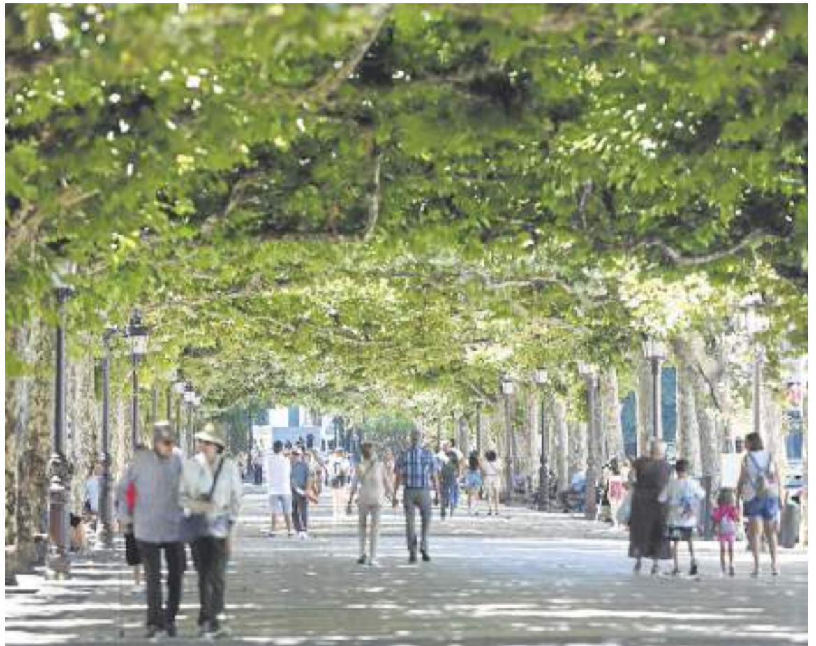
La Avenida de España una de las zonas de expansión más céntrica. LUIS PALOMEQUE

prioridad. Se está realizando un apoyo decidido a autónomos y Pymes con ayudas directas por más de 1,5 millones de euros y con ayudas indirectas a través de diferentes acciones como, por ejemplo, el Bono39300. Se están dando pasos