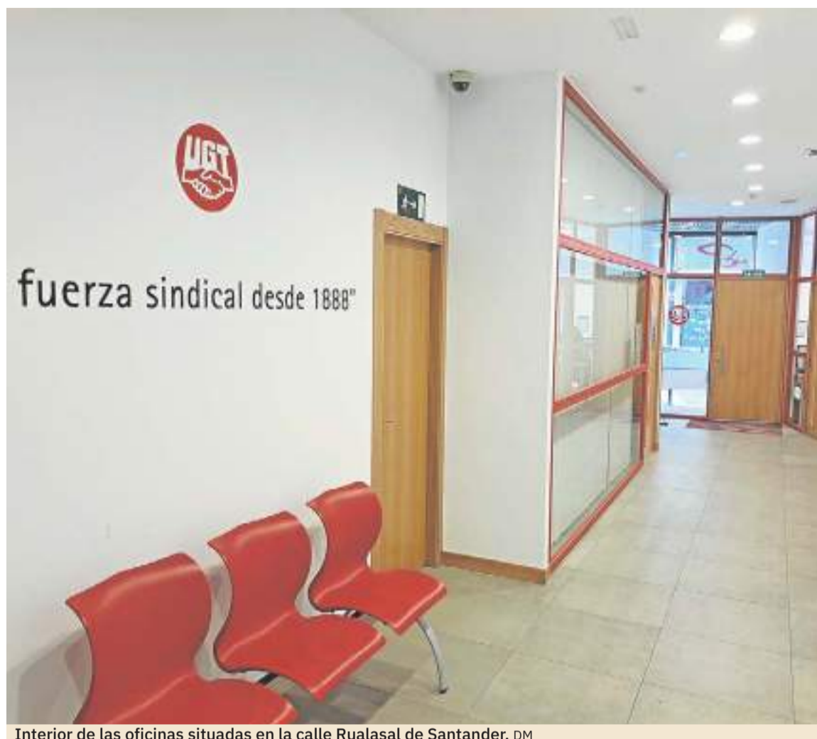
Interior de las oficinas situadas en la calle Rualasal de Santander.

dicato en Cantabria se completan con otras especializadas como la recientemente creada Área LGTBI y la del medio ambiente o UGT en