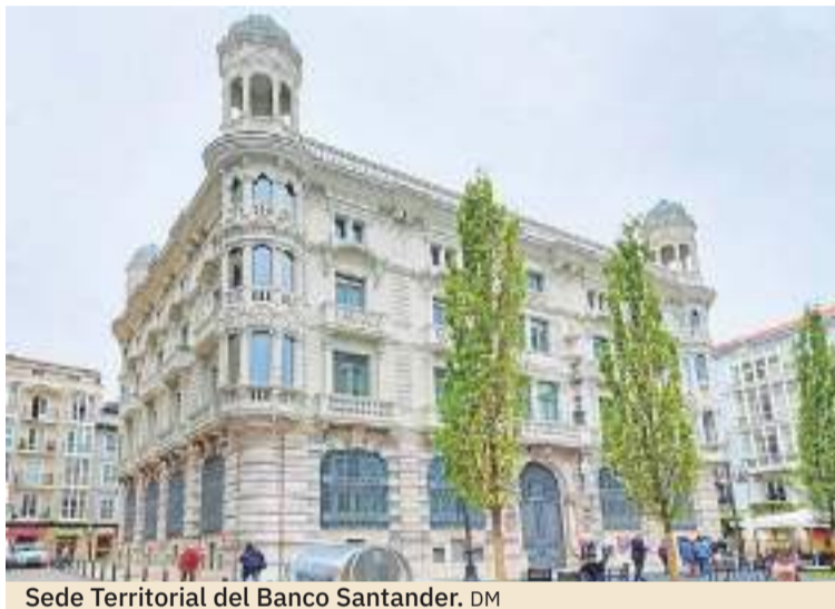
Sede Territorial del Banco Santander. DM

El compromiso de Grupo Siecsa con la sostenibilidad, va más allá de sus propias compañías, asegurando el cumplimiento de las regulaciones y estándares ambientales aplicables con un enfoque más allá del cumplimiento en los nuevos proyectos de construcción que SIEC ha venido desarrollando tanto en Cantabria como en otras regiones de España.