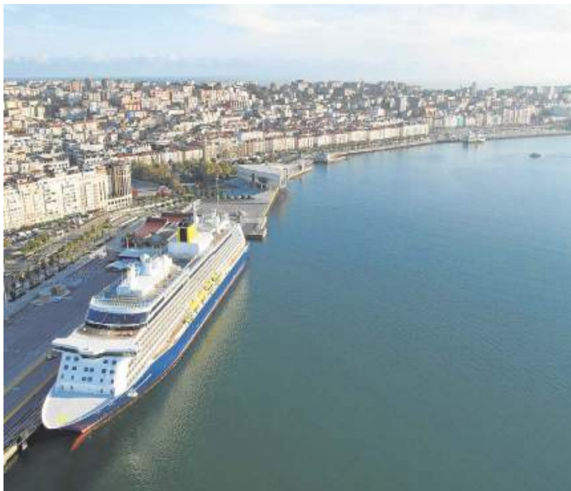
Buque de crucero en la Estación Marítima de Santander.

Pero si el compromiso de la Autoridad Portuaria con el desarrollo económico de la región es sólido, no lo es menos con la ciudad con la que comparte territorio. Así, con decisiones basadas en la colaboración institucional y la comprensión hacia las necesidades de ambos espacios, se ha propuesto impulsar la integración puerto-ciudad, transformando el frente marítimo con actuaciones en suelos que ya no son productivos para el Puerto. Entre ellas, además