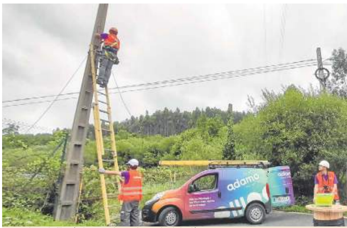
Para Adamo, la fibra óptica es un freno a la marcha de los jóvenes.

Tras invertir 60 millones en la región, y suministrar fibra óptica a más de un cuarto de millón de familias, el pasado mes de noviembre Adamo fijó su sede en Camargo para el norte de España