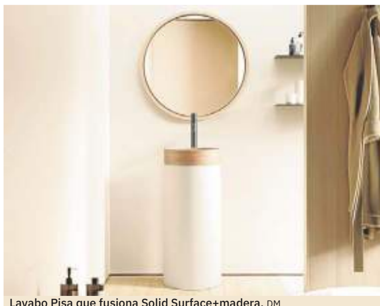
Lavabo Pisa que fusiona Solid Surface+madera. DM

conocimiento y dominio de los materiales para crear lavabos únicos que desafían lo convencional y aportan una belleza atemporal a cualquier baño. Cada pieza es el resultado de un proceso meticuloso y artístico, donde un lavabo de porcelana puede pasar a parecer de mármol o una exquisita pieza con decorados únicos.