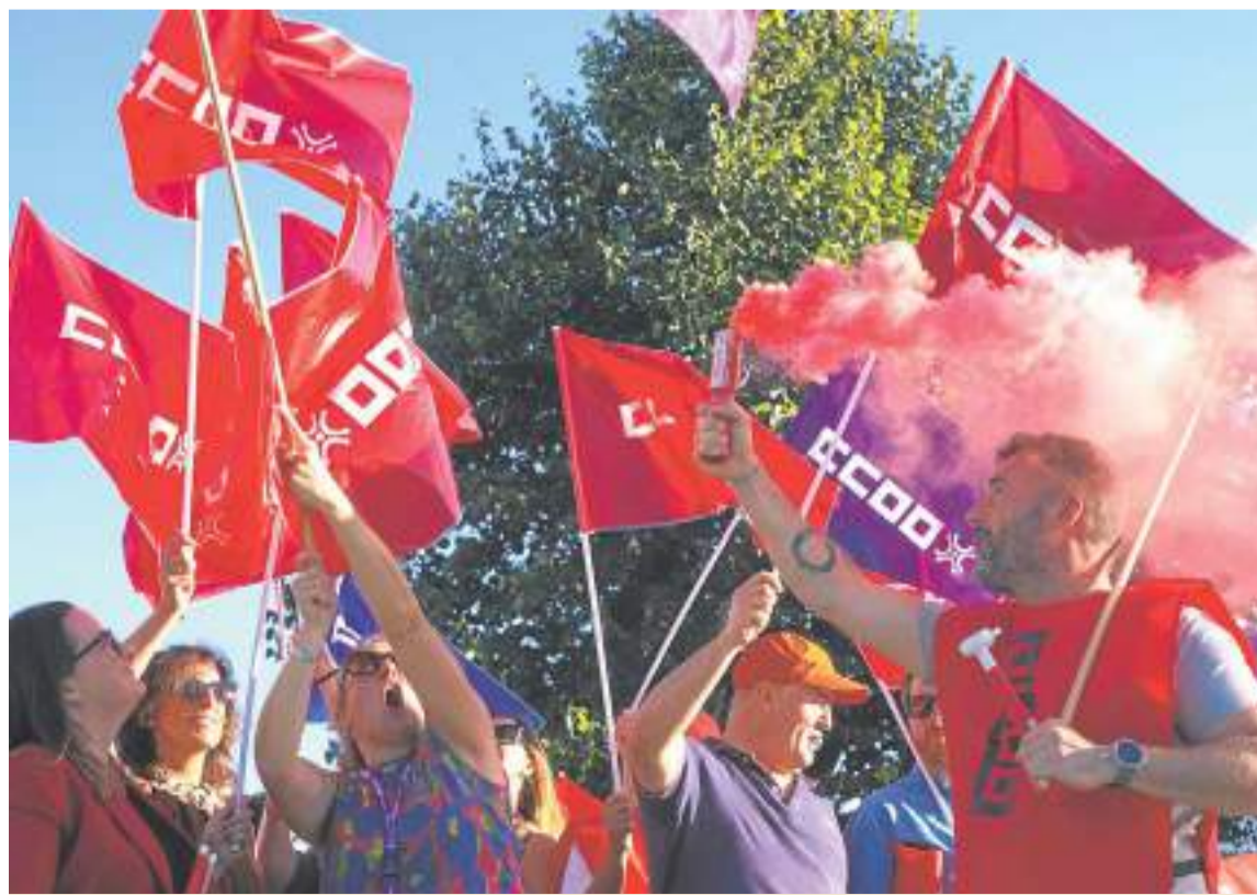
La organización sindical tiene entre sus reivindicaciones, el valor del trabajo. DM

En nuestra hoja de ruta está la igualdad de derechos y oportunidades para hombres y mujeres, la mejora en la seguridad en el empleo y