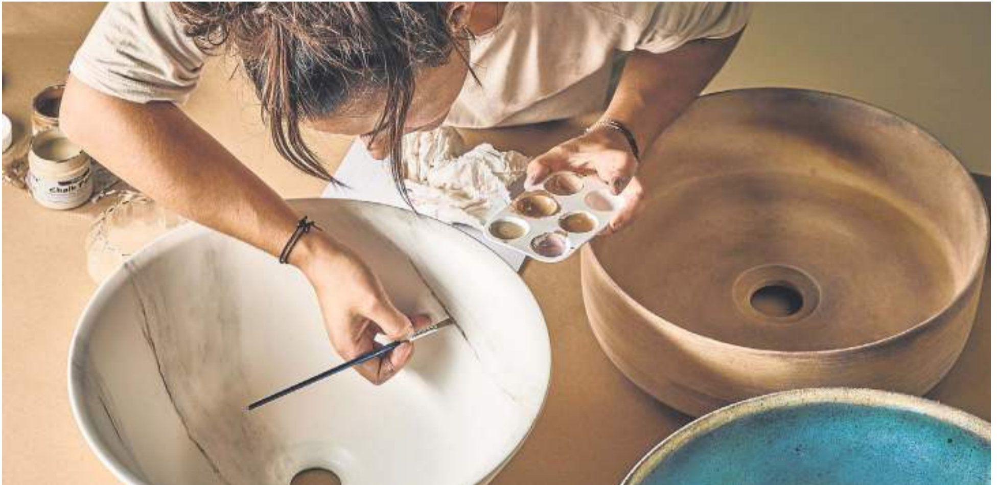
Artista del Atelier de Bathco decorando lavabos a mano. DM

Su estrategia I+D+i en la creación de productos combina funcionalidad y estética