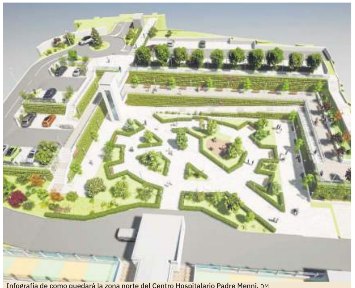
Infografía de como quedará la zona norte del Centro Hospitalario Padre Menni.

El centro continúa con su proceso de reforma integral de sus instalaciones, siendo la próxima fase a inaugurar la correspondiente a la parcela 'Consuelo Berges'