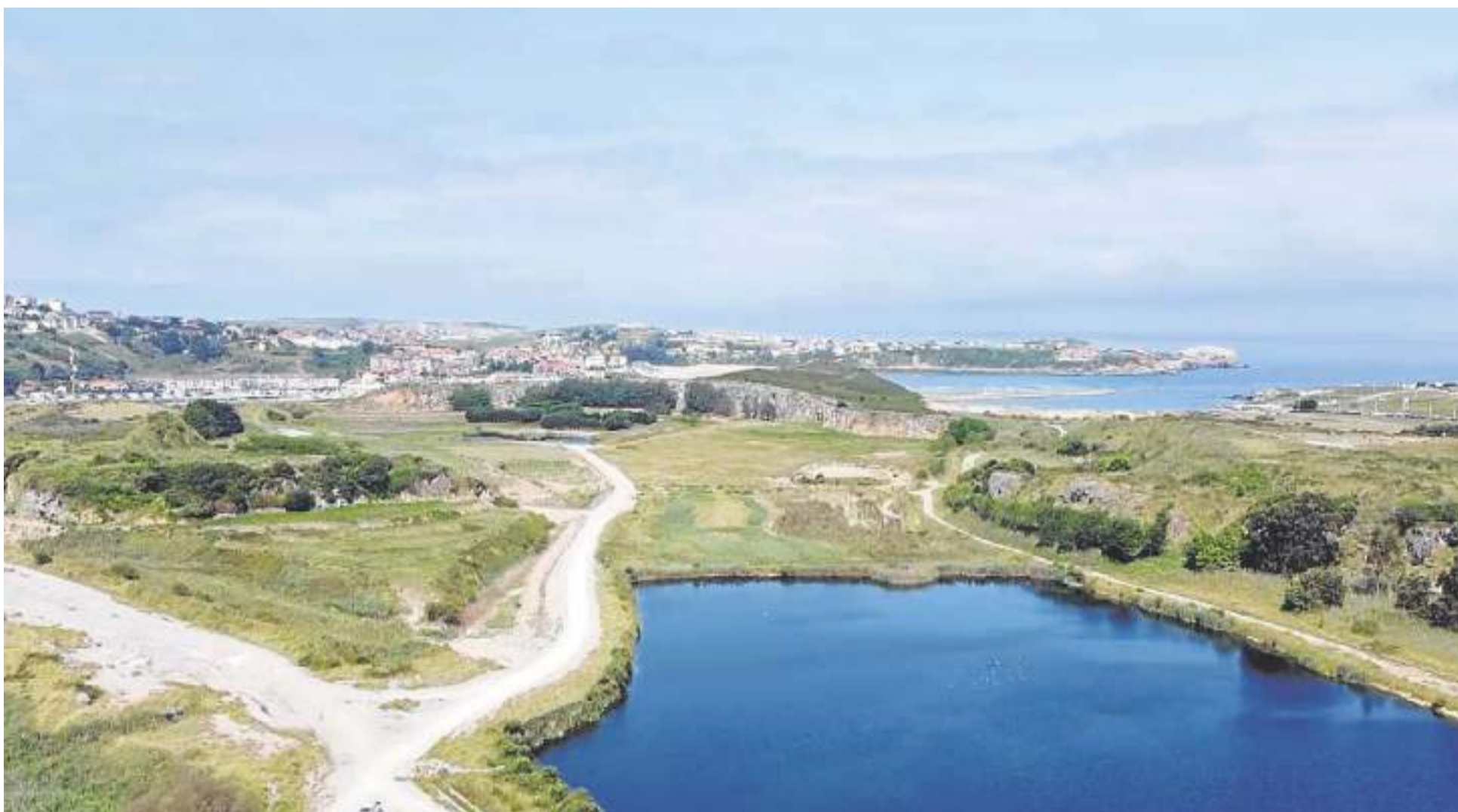
El resultado del proyecto de restauración ecológica de la antigua cantera de Solvay en Cuchía, reconocido con el premio CEFIC 2021 en la categoría 'Preservación de ecosistemas', es un magnífico legado. DM