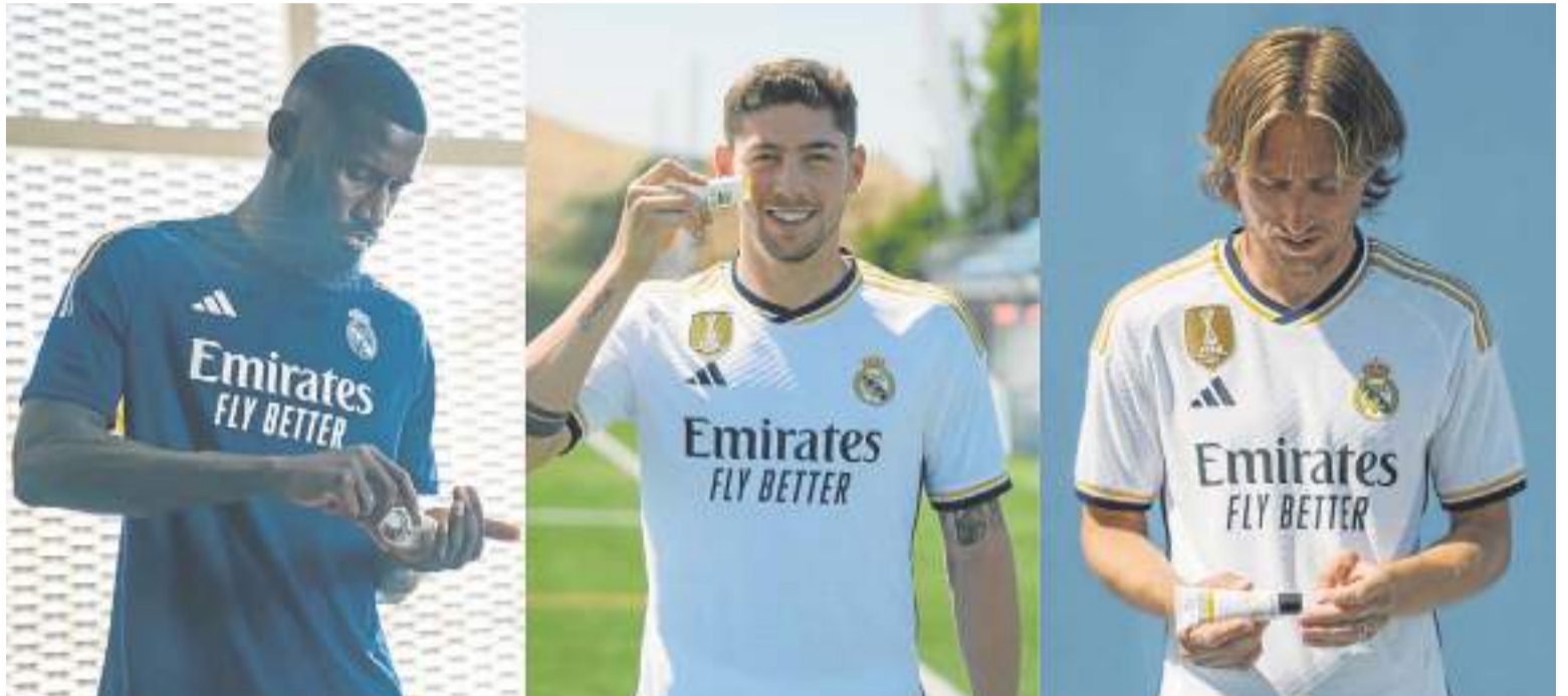
Rüdiger, Valverde y Modrić, jugadores del Real Madrid, en su campaña 'Train Your Skin' con Cantabria Labs.