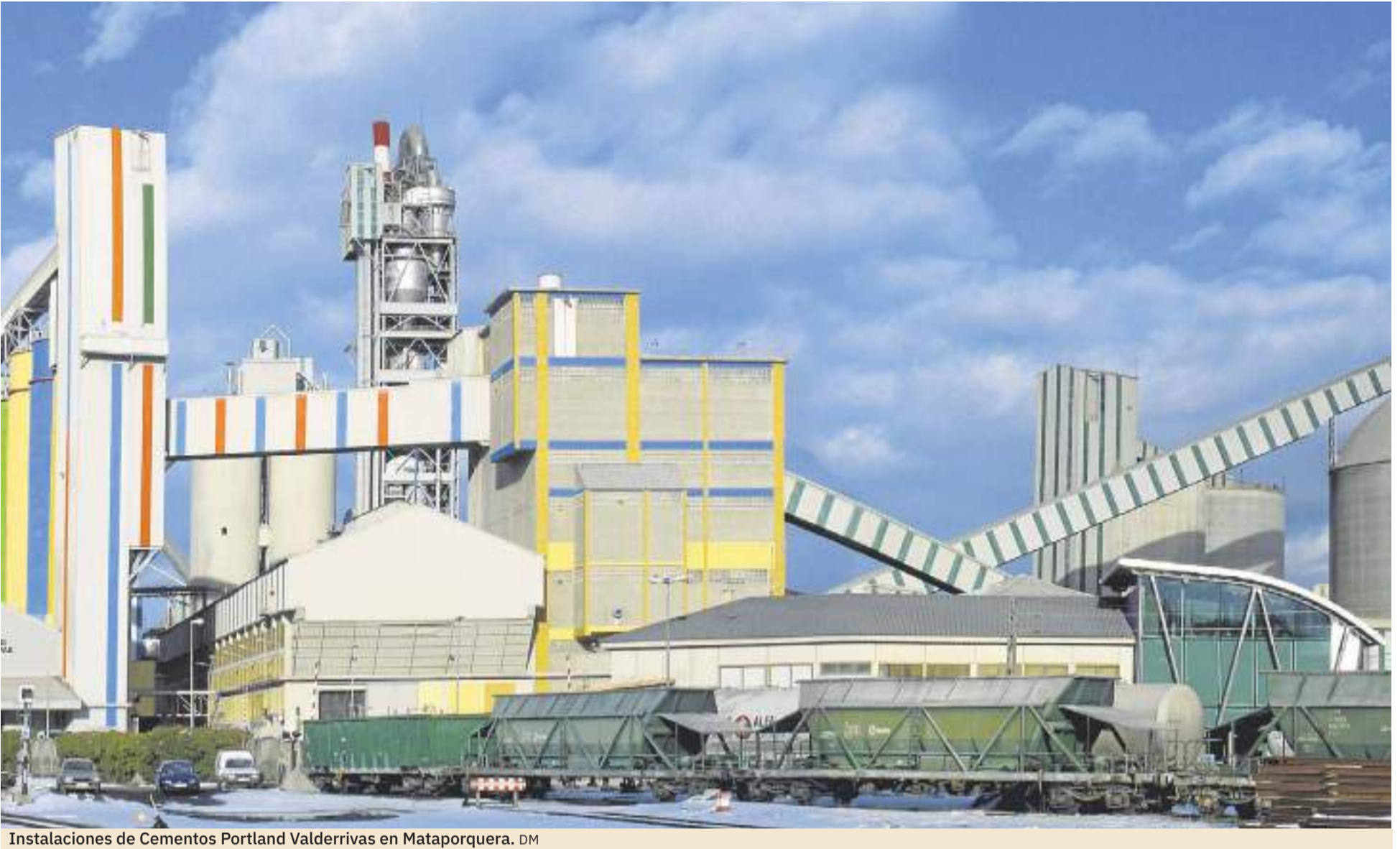
Instalaciones de Cementos Portland Valderrivas en Mataporquera. DM