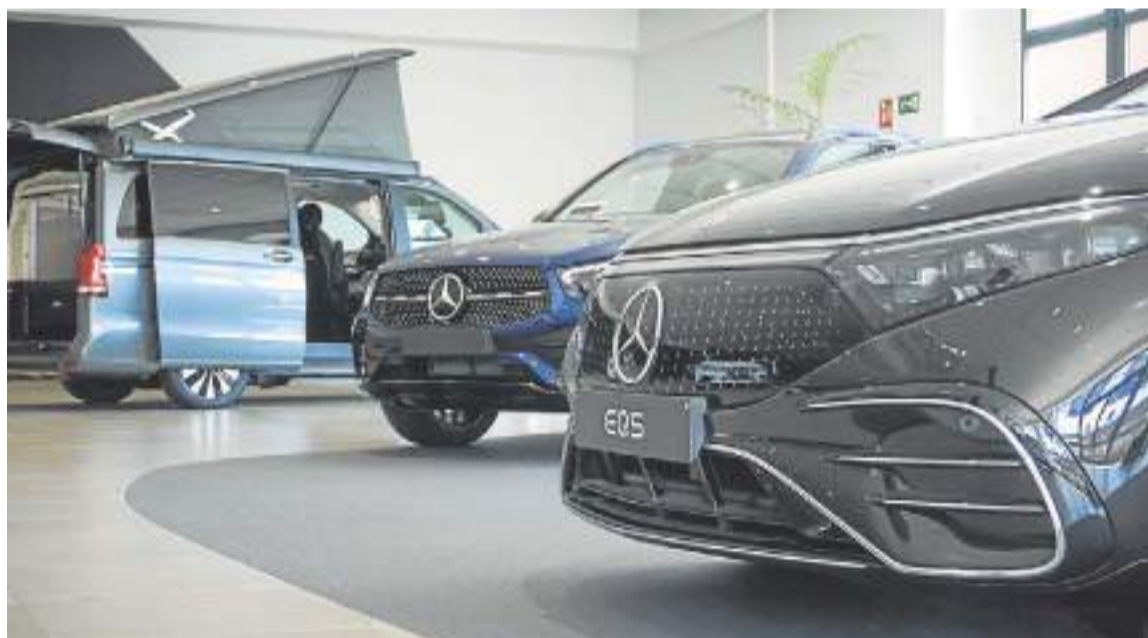
La gama EQ de Mercedes-Benz ha revolucionado el mundo del motor. DM

En su interior, destaca la nueva pantalla Hyperscreen que protago-