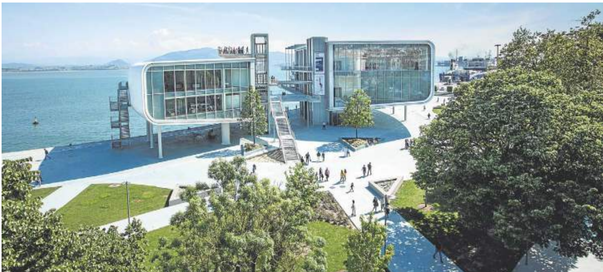
Panorámica del centro de arte inaugurado en el año 2017 en Santander. DM