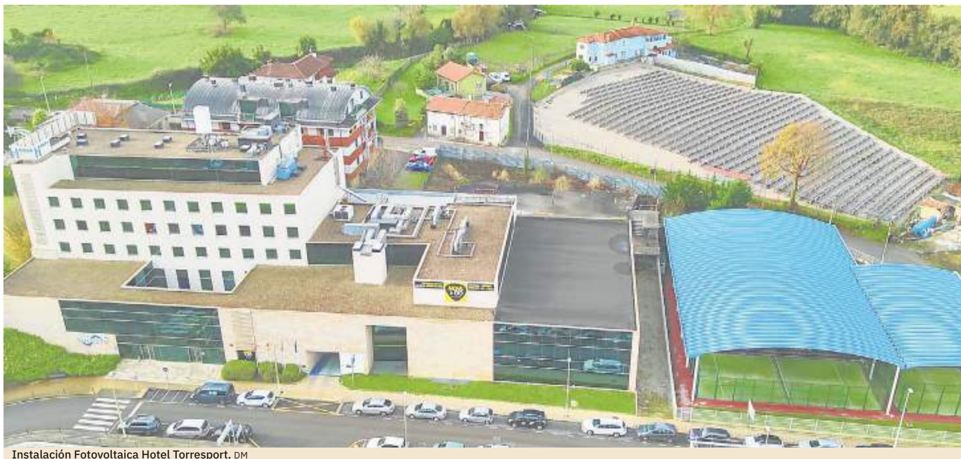
Instalación Fotovoltáica Hotel Torresport. DM

Grupo Siecsa sigue avanzando hacia el futuro desde la responsabilidad social y el compromiso con nuestros 'stakeholders', siempre apostando por la innovación en los procesos, la sostenibilidad y los valores que le han caracterizado desde sus orígenes.