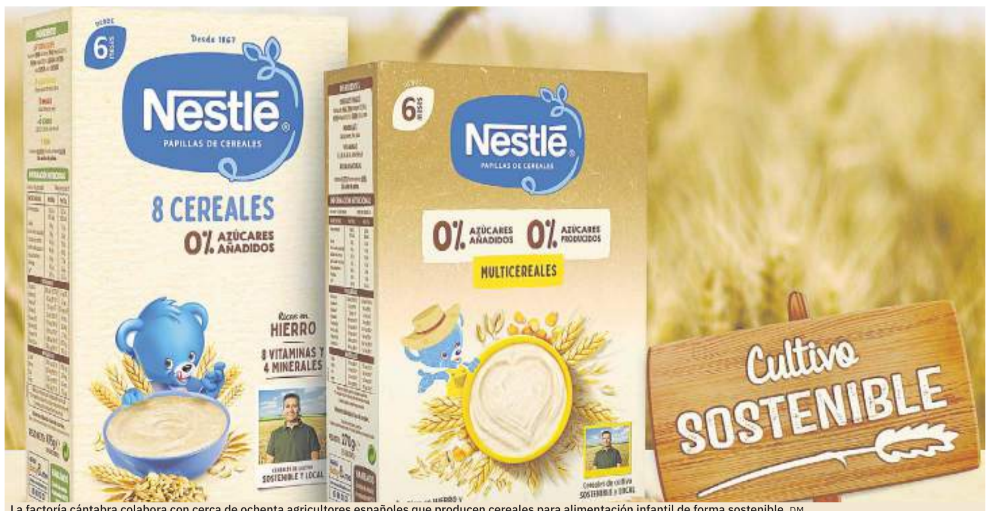
La factoría cántabra colabora con cerca de ochenta agricultores españoles que producen cereales para alimentación infantil de forma sostenible. DM

Con esta gama, son más de 70 los productos que, en total, se elaboran en la factoría cántabra entre las categorías de nutrición infantil, chocolates, culinarios y cafés.