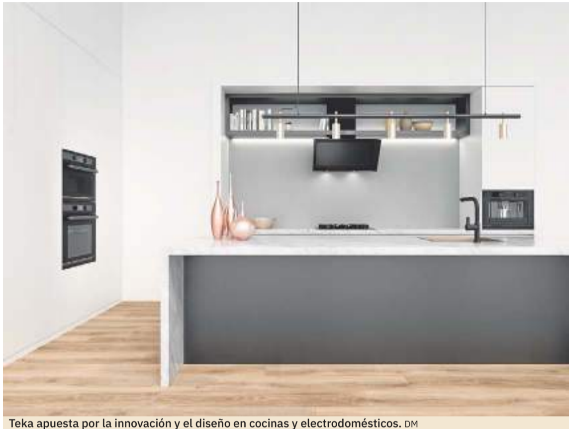
Teka apuesta por la innovación y el diseño en cocinas y electrodomésticos.