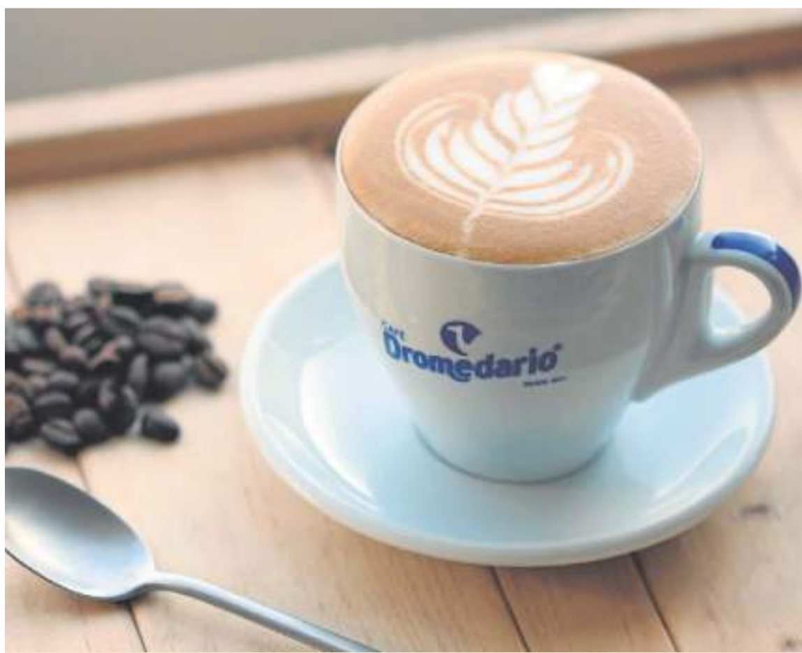
Café Dromedario es el tostador de café más antiguo de España.

Este sello certifica que el 100% de los residuos generados en sus instalaciones son reciclados o utilizados para generar energía. Siendo en este momento la única empresa con el sello en vigor en Cantabria.