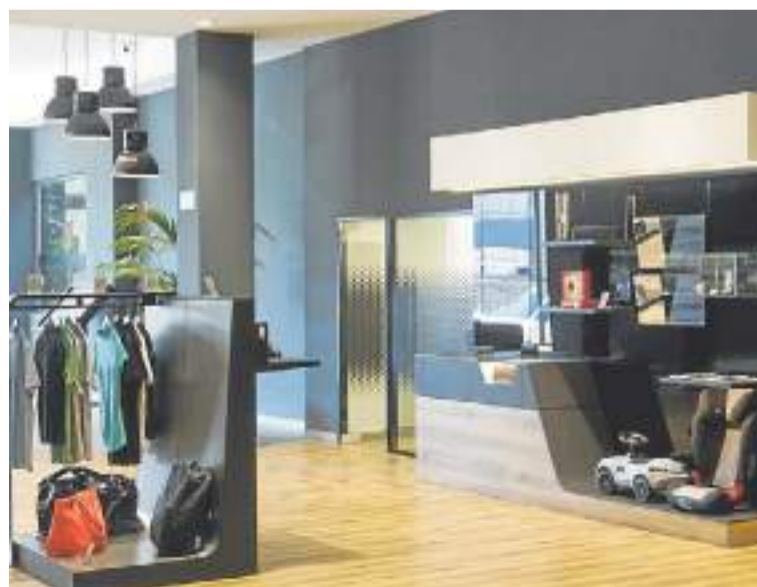
Mercedes-Benz ha lanzado una línea de ropa y complementos, también disponible en la boutique del concesionario Adarsa Santander. DM

Nacido en 1978 como Concesionario Mercedes-Benz en Asturias, Adarsa es hoy en día referencia obligatoria en la industria de servicios para la automoción en España, estando presente en las provincias de Asturias, Cantabria, León, Zamora, Palencia Salamanca, Valladolid y Huelva con concesionarios y talleres autorizados Mercedes-Benz, smart y Mitsubishi. Además, distribuye de forma oficial las motos eléctricas RAY y da servicio de alquiler de vehículos con AdarsaRent.