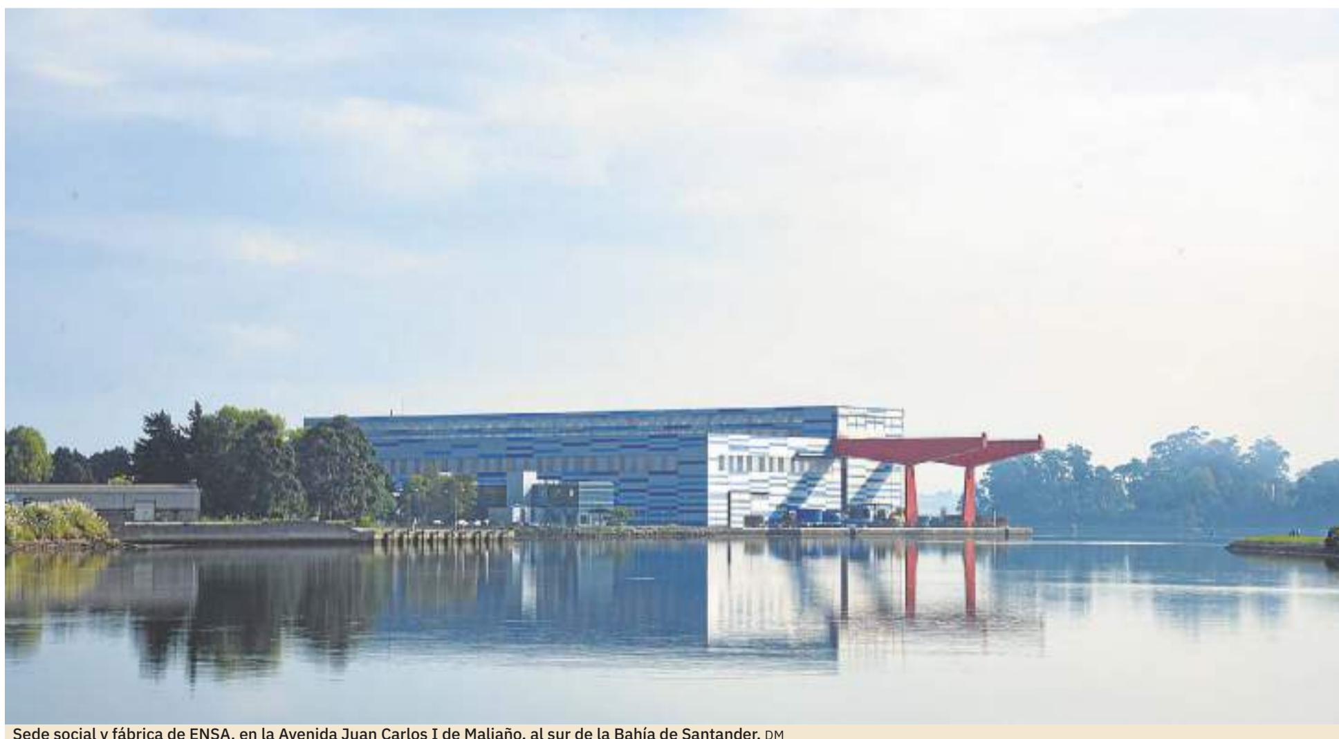
Sede social y fábrica de ENSA, en la Avenida Juan Carlos I de Maliaño, al sur de la Bahía de Santander. DM

De hecho, debido a su responsabilidad con la sociedad, ENSA en 2008 impulsó su Plan de Igualdad, el primero registrado en Cantabria y uno de los diez primeros presentados en España. El fuerte compromiso con el cumplimiento de los principios y valores de ENSA, recogidos en su código de conducta, está alineado con su accionariado y sus clientes, colaboradores y suministradores.