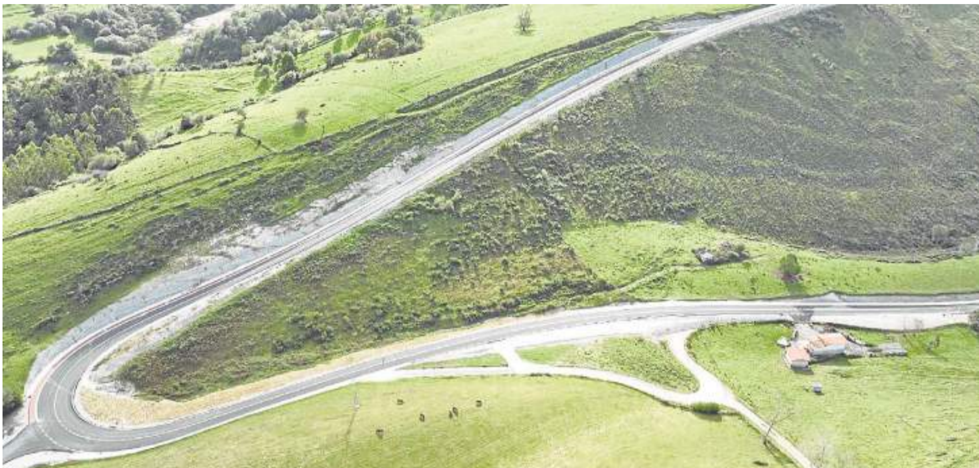
Carretera ejecutada por Copsesa entre Labarces y La Florida (Valdáliga). DM